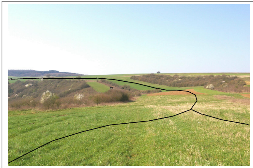
Abb. 3 Ungefähr entlang den eingezeichneten Linien sollen sich die geplan- ten Baugebiete erstrecken

Die süd- bis südostexponierten Hanglagen, die bei der ursprünglichen Planung unberührt geblieben wären und jetzt vermarktet werden sollen, sind von weither einsehbar. Sie werden zwar überwiegend von Ackerland eingenommen, doch grenzen Hecken und Waldstücke unmittelbar an (Abb.3).